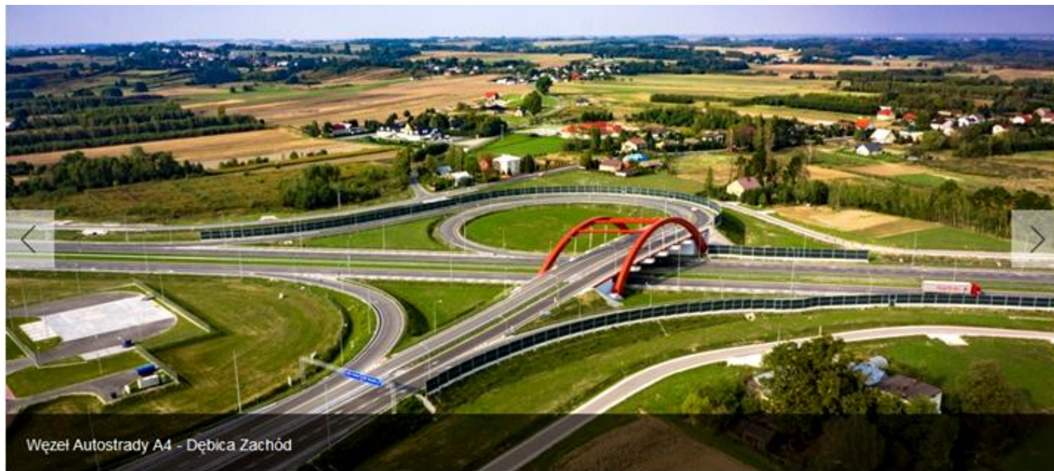
Węzeł Autostrady A4 - Dębica Zachód